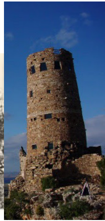
מגדל שמירה (שומרה) בהר שומרון.

http://wp.patheos.com.s3.amazonaws.com/blogs/billintheblank/files/2012/12/shepherd-Angels.jpg