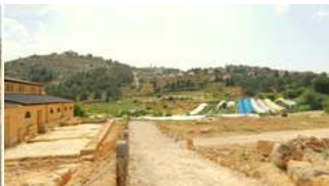
Shilon viinitarhoja ja taustalla

Viime syksynä pienen rukousryhmän kanssa lähdimme matkalle Suomesta etsimään "muinaisia polkuja" ja Herra johdatti esi-isien valtatielle, jota kulkiessa Hän halusi puhua meille . Esirukouksin poistimme "kiviä teiltä" Efraimin palata ja rukoilimme