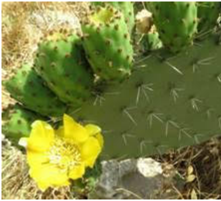
Sabra - kaktus, joka kuvaa maassasyntyntä israelilaista