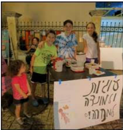
Zichron Ja'akovin lapsia Sukkotin aikaan käydessäni siellä v. 2013