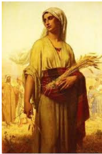
"Ruth in the Fields" By Eugène Delacroix (1823-1881)