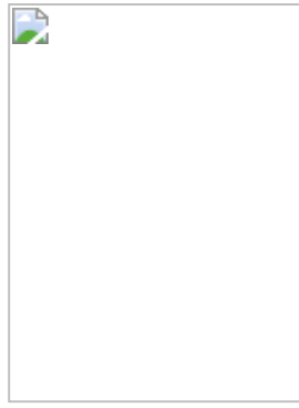
Shavuot by Moritz Daniel Oppenheim

Jotkut synagogat koristelevat bema korokkeen katoksen kukin ja kasvein niin, että se muistuttaa chupaa eli hääkatosta, koska Shavuot oli päivä, jolloin "avioliiton välimies" (Mooses) toi morsiamen (Israelin kansa) chupaan (Siinain vuori) vihittäväksi sulhaselleen (JHVH). Ketuba (vihkitodistus) oli Toora; kymmenen käskyä, ohjetta. Jotkut sefardiyhteisöt idässä lukevat jopa ketuban JHVH:n ja Israelin välillä osana jumalanpalvelusta. Shavuot - Wikipedia, the free encyclopedia