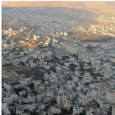
Nablus, muinaisen Shechemin paikalla

Simeon, Leevi, Juuda, Isaskar, Joosef ja Benjamin.