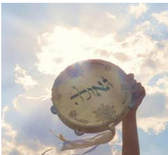
Geula / lunastus

21. Ja Mirjam viritti heille virren: "Veisatkaa Herralle, sillä hän on ylen korkea, hevoset ja miehet hän mereen syöksi".