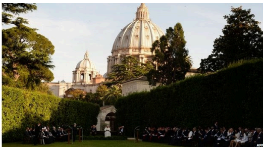
Israelin presidentti Shimon Peres, paavi Franciscus ja palestiinalaishallinnon presidentti Mahmud Abbas rukoushetkessä Vatikaanissa