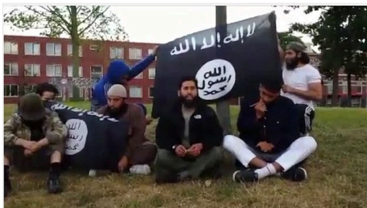
Salafi Jihad (@Salafi_Jihad) @IslamistStore: Muslims in Netherlands show their support for the Islamic Caliphate YouTube.com/watch?v=92XEYA... pic.twitter.com/PK0mT10v

Ramadanin ensimmäisenä päivänä v. 2014 IS:n Abu Bakr al-Baghdadin julistettiin olevan johtaja, "kalifi" (tark. kaikkien muslimien johtaja kaikkialla maailmassa), uudessa islamilaisessa "kalifaatissa" : "Kuunnelkaa kalifianne ja totelkaa häntä. Tukekaa valtiotanne, joka kasvaa joka päivä."