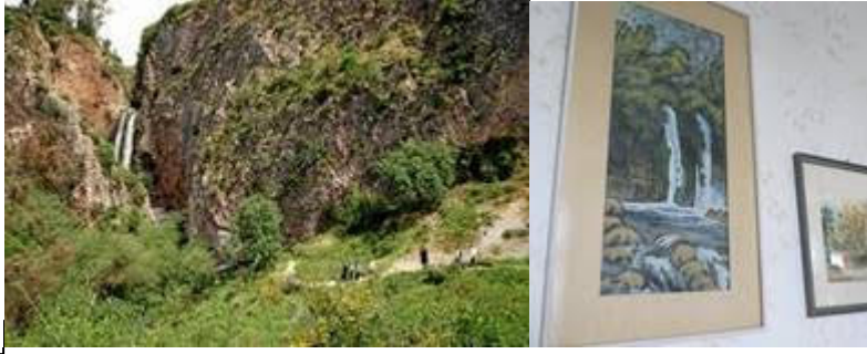
Taulu Karmel-kodin seinällä.

Baniasin/Panias putoukset , (+ oik. Metulla Nahal Lyon Tannur ; nämä kaksi eri putousta), joissa kaksoisputous. Paikka liittynyt ennen hellenismisiä Baalin palvontaan, josta Banias nimikin juontuu.