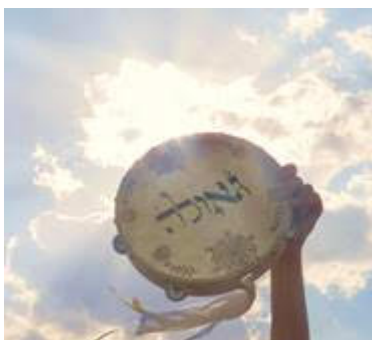
"Geula" tark. "lunastus"

Olemme historian suurten tapahtumien edessä, kun Exodus II alkaa.