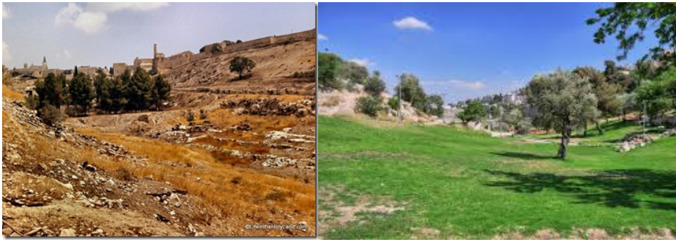
Hinnomin laakso v. 1966 (David