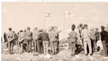
Siniristiliput liehuivat Jerusalemmissa Kuuden päivän sodan aikana

Mielestäni tapahtumalla on myös profeetallinen sanoma: Suomen lippu oli Messiaan symbolina, kun Israel voitti vihollisensa ja vapautti pyhän kaupungin, Jerusalemn.