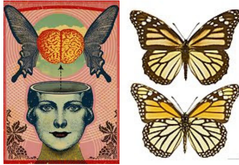
Tekstiin lisättävä kuva 2

Illuminaateilla on ollut jo kauan käytössä ns. Monarch-ohjelmointi , joka on trauman kautta tehty mielen nujertaminen ja muokkaus. Tätä menetelmää testasivat jo natsit keskitysleireillään. Hitler kuului illuminaatteihin ja oli syvällä okkultismissa. Mutta tätä eivät käyttäneet vain natsit, vaan sitä yhä käytetään illuminaattien piirissä, perheissä ja suvuissa ja lapset joutuvat läpikäymään julmaa kasvatusta hyväksikäyttöineen. Nämä ovat raskaita asioita, mutta maailmassa on pimeyttä, joka on nousemassa pian näkyville; 7 vuotta on Raamatussa aika, jolloin Peto saa hallita.