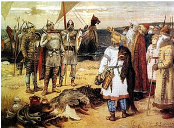
Rurik ja hänen veljensä saapuvat Laatokankaupunkiin.

Vuosisatoja myöhemmin nykyisen Lounais-Venäjän alueella asuvien suomalais-ugrilaisten heimojen (tsuurit, merjalaiset, vepsäläiset) sekä slaavilaisten jatkuvia taisteluja selvittämään kutsuttiin 860-luvulla kolme varjagi- eli viikinkipäällikköä; Rurik, Sineus ja Truvor , meren takaa, Skandinavian alueelta, ”russien” maasta. Näiden veljesten mukaan novgorodilaiset nimittivät maataan Russkaja zemljaksi, Rusien maaksi.