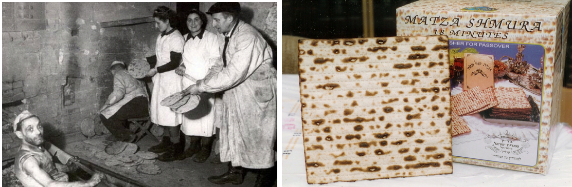
Juutalaiset piilopaikassaan Puolassa paistavat matzoja v. 1943

Miksi näin jyrkkä käsky? Ennen pesachia ja happamattoman leivän juhlaa alkaa jokaisessa israelilaiskodissa valmistelut juhlaan: Etsitään kaikkialta kaapeista ja hyllyistä, ettei talossa olisi yhtään hapanta ruoka-ainetta. Kaikki hapantähtäviä hävitetään. Seitsemän päivää syödään vain happamatonta leipää. On hyvä ymmärtää, että kyseessä ei ole vain olla syömättä hapanta, vaan samalla on käsky syödä happamatonta.