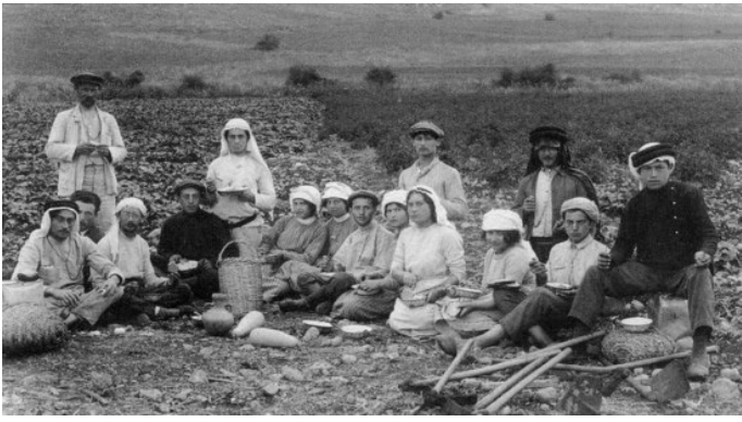
juutalaisia maahanmuuttajia ensimmäisen alijan aikaan 1880-luvun lopulla

Sionististen aatteiden innostamana Israelin alueelle, joka silloin kuului Turkkiin, alkoi muuttaa juutalaisia vuosina 1881–1903 ja 1904–1914. Näiden muuttoliikkeiden aikana heprean kieltä alettiin elvyttää, ja alueella syntyi hepreankielistä lehdistöä ja kirjallisuutta.